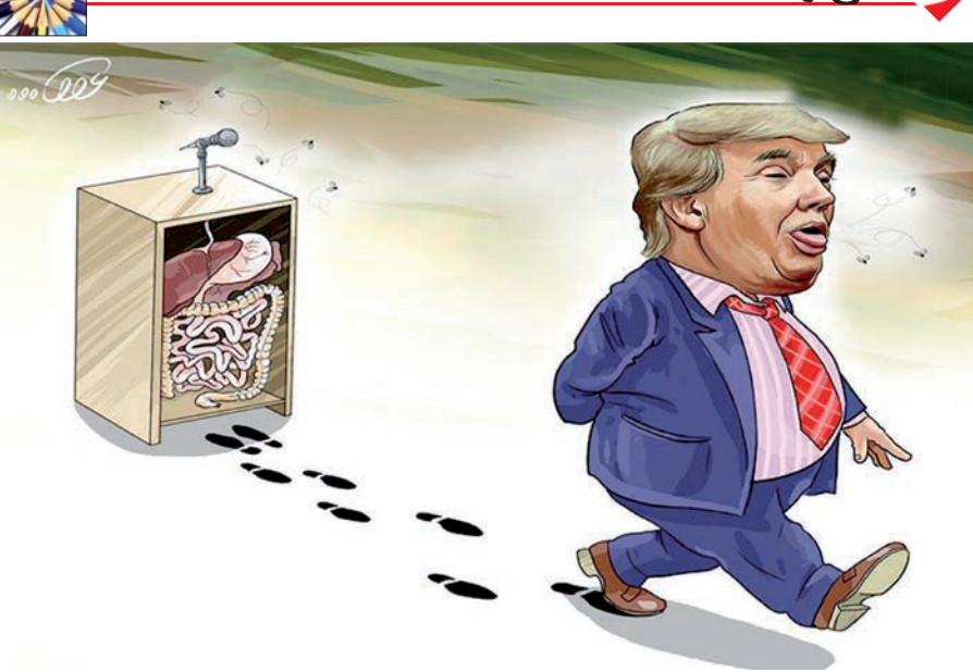
تیلر سون: ترامپ «احمق» است