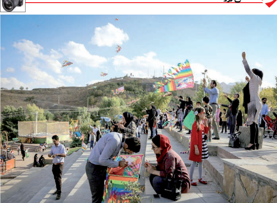
جشن بادبادک ها در همدان